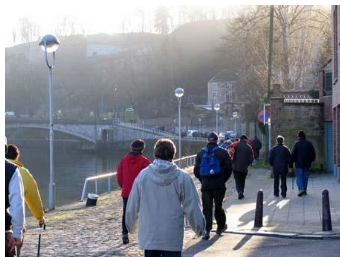
citadel van Namen '07