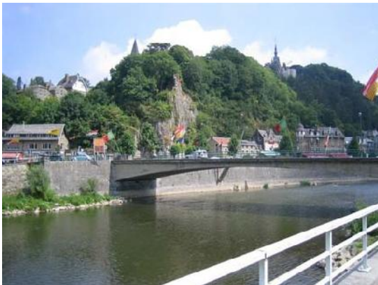
Luik / Liège

Hamoir ('94), Malmedy ('95), Allé ('96), Remouchamps ('97), Furfooz ('98),